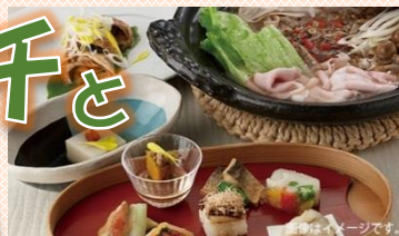
茅乃舎ランチ(イメージ)