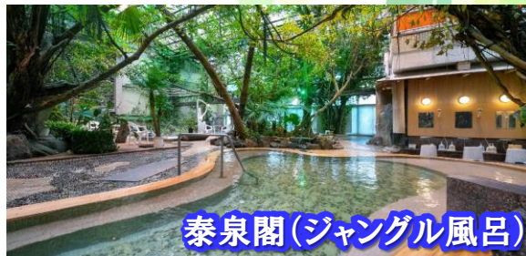
泰泉閣(ジャングル風呂)

(注)入浴の際、フェイスタオルの 利用はサービスとなります。 バスタオル利用の場合は、 150円が別途必要となります。