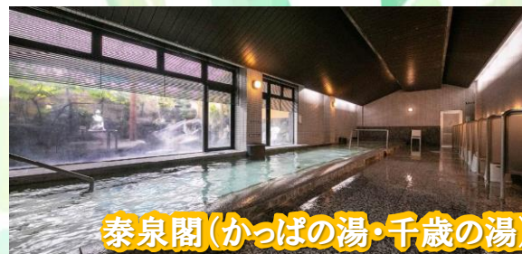
泰泉閣(かっぱの湯・千歳の湯)