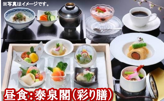
昼食:泰泉閣(彩り膳)

行 (各地出発 7:05~8:10) 道の駅おとう桜街道(買物) - 香山昇龍大観音(見学) - 泰泉閣(昼食/入浴) - 巨峰ワイナリー(見学/買物) 程 (各地到着 17:05~18:05)