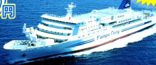
はまゆう号 (イージ)