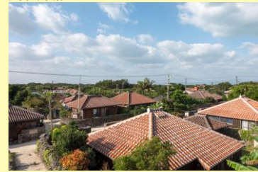
竹富島集落イメージ