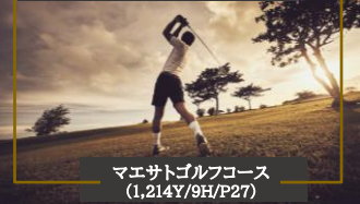
マエサトゴルフコース (1,214Y/9H/P27)