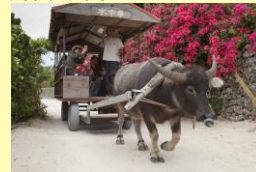
竹富島・水牛車イメージ

旅行代金に含まれるもの:往復乗船、西表島バス観光、仲間川遊覧、 由布島水牛車・入園料、竹富島水牛車観光、昼食