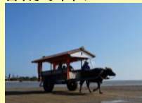
由布島・水牛車イメージ