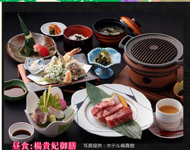
昼食:楊貴妃御膳