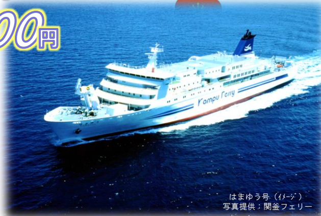
はまゆう号 (イメージ)

(フェリー2等船室・釜山観光ホテル2名1室利用/大人お一人様)※燃油サーチャージ・国際観光旅客税・港湾税等が別途必要です